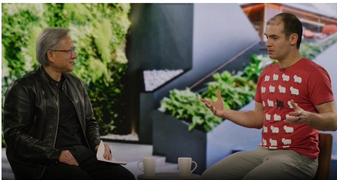
CEO-ul NVIDIA, Jensen Huang în dialog cu Ilya Sutskever la GTS 2023

„Cu siguranță vom putea crea entități complet autonome, cu obiective proprii, și va fi foarte important, mai ales pe măsură ce acestea devin mult mai inteligente decât oamenii, ca obiectivele lor să fie aliniată cu ale noastre.” [1] Aceasta declarație aparține uneia dintre cele mai misterioase figuri din domeniul Inteligenței Artificiale (AI), Ilya Sutskever. Ilya este un informatician reputat, direct implicat în dezvoltarea OpenAI și ChatGPT, susținut și apreciat pentru cercetările sale, printre alții, de Sam Altman, Elon Musk, Jensen Huang și Geoffrey Hinton.