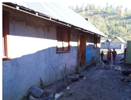
Locuință construită de o organizație religioasă pentru o familie de romi. Mama era însă nemulțumită de faptul că locuința nu este finisată și nu beneficiază de utilități