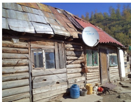
Case realizate din materiale recuperate