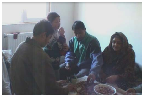
La curățat de nuci. O activitate la care participă întreaga familie

Romii din cartierul Drochia trăiesc din comerțul cu nuci: „... în fiecare casă de altfel, o cameră este plină până în pod cu saci de nuci”, observă un jurnalist 13 . Ei sparg nucile acasă și miezul îl vând la piață. Cât despre cojile nucilor, le schimbă pe lapte sau cartofi (un fel de troc) deoarece sunt folosite de localnici drept combustibil solid: „decât să mergem la furat mai bine, uită așa, muncim”, afirmă una dintre persoanele intervievate, de etnie romă.