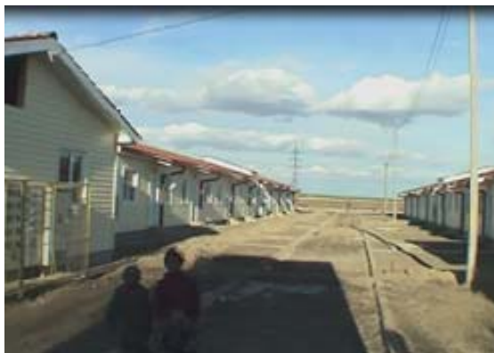
Locuințe sociale înșiruite, Dorohoi