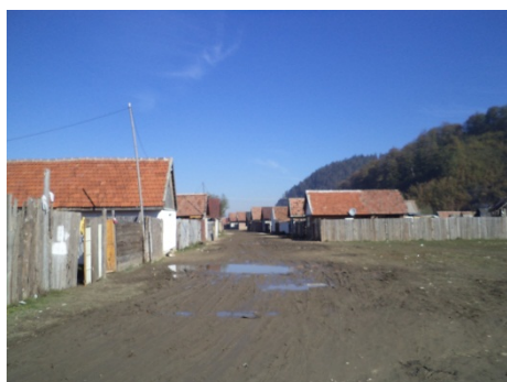
Intrarea în țigănie