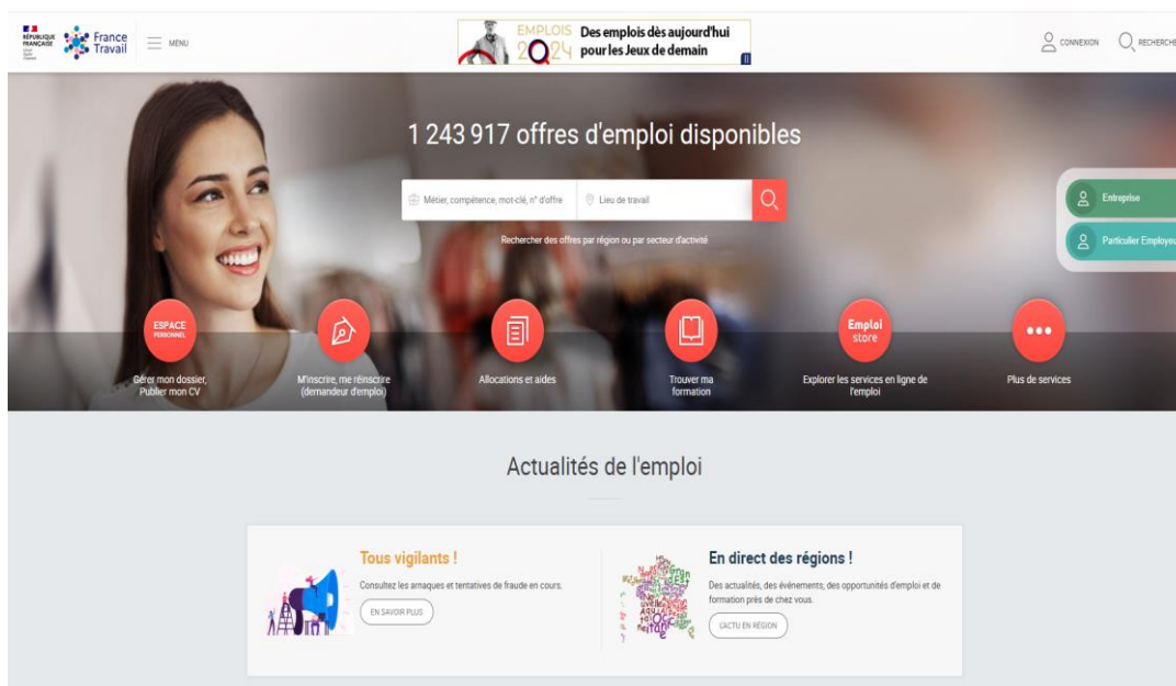
Fig. 3 Pagina de întâmpinare a Serviciului Public Național de Ocupare a Forței de Muncă – Franța

Franța: Pôle emploi este serviciul public național de ocupare a forței de muncă din Franța, funcționează ca organism administrativ public sub supravegherea Ministerului Muncii și este responsabil cu furnizarea de servicii de plasare a unui loc de muncă, de formare și de șomaj. Serviciul public de ocupare este disponibil cetățenilor prin intermediul birourilor locale și a platformelor online. Pôle emploi operează prin birouri regionale și locale în toată Franța, deservind diferite zone geografice. Aceste birouri oferă asistență personalizată persoanelor aflate în căutarea unui loc de muncă și angajatorilor, inclusiv consiliere, potrivire a locurilor de muncă cu persoanele în căutarea unui loc de muncă dar și programe de formare, administrarea prestațiilor de șomaj.