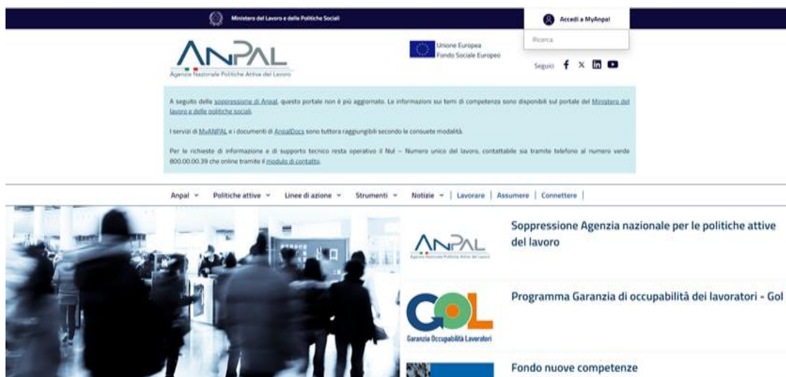
Fig. 4 Pagina de întâmpinare a Agenției Naționale pentru Ocuparea Forței de Muncă (ANPAL) – Italia

Italia: Agenția Națională pentru Ocuparea Forței de Muncă (ANPAL) și agențiile regionale furnizează servicii publice de ocupare la nivel național, regional și local, accesibile online și prin intermediul birourilor locale. Serviciul Public de Ocupare (Servizio Pubblico per l'Impiego - SPI) este principala agenție publică responsabilă de serviciile și politicile de ocupare a forței de muncă în Italia. Aceasta funcționează sub supravegherea Ministerului Muncii și Politicilor Sociale. SPI operează printr-o rețea de centre locale de angajare situate în toată Italia și care servesc drept birouri “de primă linie” unde persoanele aflate în căutarea unui loc de muncă și angajatorii pot accesa servicii și resurse legate de angajare. Printre serviciile oferite menționăm cele legate de ocuparea forței de muncă, inclusiv plasarea unui loc de muncă, consiliere în carieră, formare profesională și administrarea indemnizațiilor de șomaj.